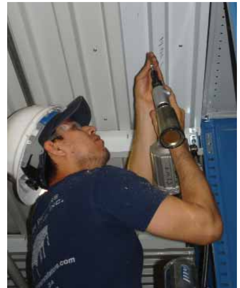
Figura A Invisi-Loc ® Sistema de Fixação Inferior

Favor entrar em contato com a Cornerstone Specialty Wood Products para obter mais detalhes sobre o produto, garantia, vendas de ferramentas e alugueis.